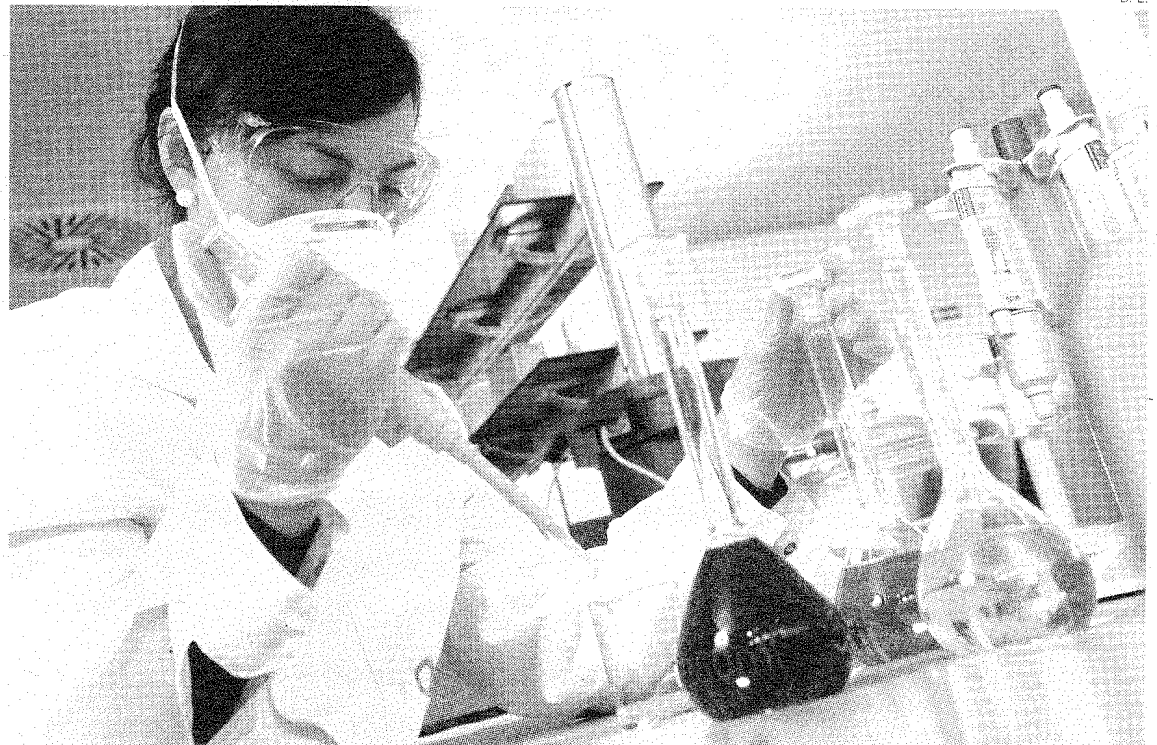
La inversión en I+D es uno de los pilares básicos para el crecimiento y desarrollo del sector

No en vano, el 58% de las empresas que trabajan con institutos tecnoló-